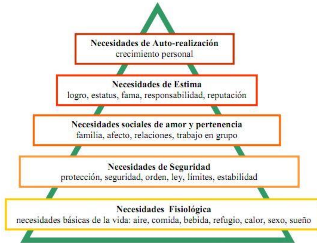
Figura 1. Adaptado de Chapman (2007).